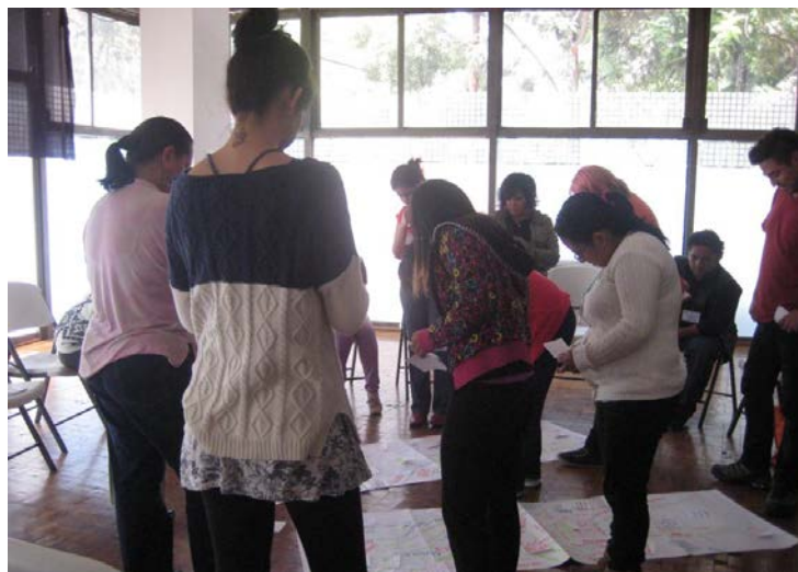
© Secretariat de Cultura del Gobierno del Distrito Federal, Subdirección de Pequeñas Empresas Culturales, 2014