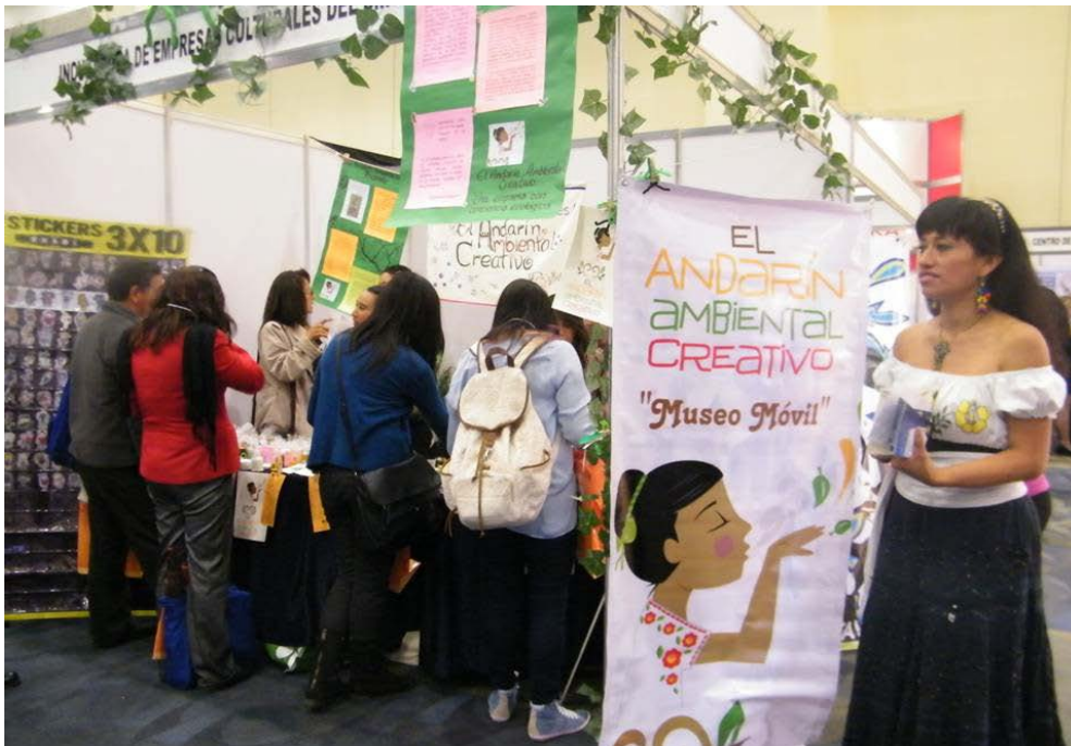
© Secretariat de Cultura del Gobierno del Distrito Federal, Subdirección de Pequeñas Empresas Culturales, 2014

EMPLEO EMPoderamiento GESTIÓN SOCIAL ESTRATEGIA CULTURAL SOSTENIBILIDAD ECONÓMICA INDUSTRIAS CREATIVAS