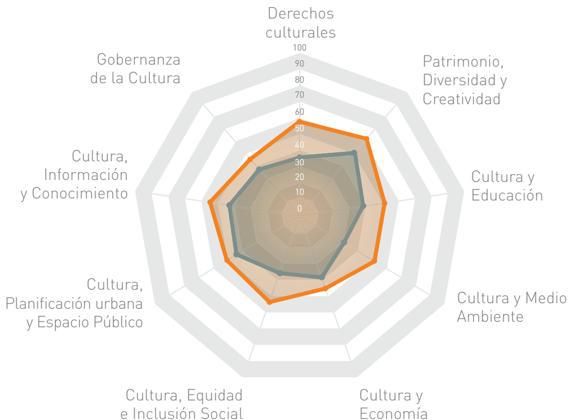
Figura 1 : Taller de autoevaluación en Lisboa

El gráfico 1 reproduce el Radar con los resultados del primer taller. Los resultados emitidos son muy favorables de manera general. El radar también señala las áreas más débiles: gobernanza; cultura y economía; y cultura y educación. Muestra también los puntos fuertes de la ciudad: cultura, igualdad e inclusión social; derechos culturales; y patrimonio cultural, diversidad y creatividad.