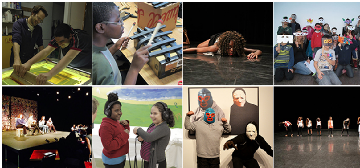
© Teatro en las Caballerizas, La Nave, Circuito-Este centro coreográfico, RIDM/Emily Gan, FIV, Exeko

Con el objetivo de favorecer el desarrollo cultural local y para reforzar la participación de los ciudadanos en la vida cultural de Montreal, la Ciudad apoya a los distritos montrealeses, así como a los organismos culturales y comunitarios, en la realización de proyectos de mediación cultural en toda la ciudad. Los proyectos son llevados a cabo en colaboración con diversos sectores culturales municipales : la red Acceso Cultura, Bibliotecas de Montreal , la Oficina de Arte Público, la Oficina de Recreación, la División de Acción Cultural y alianzas que coordina el conjunto de las acciones presentadas en este texto.